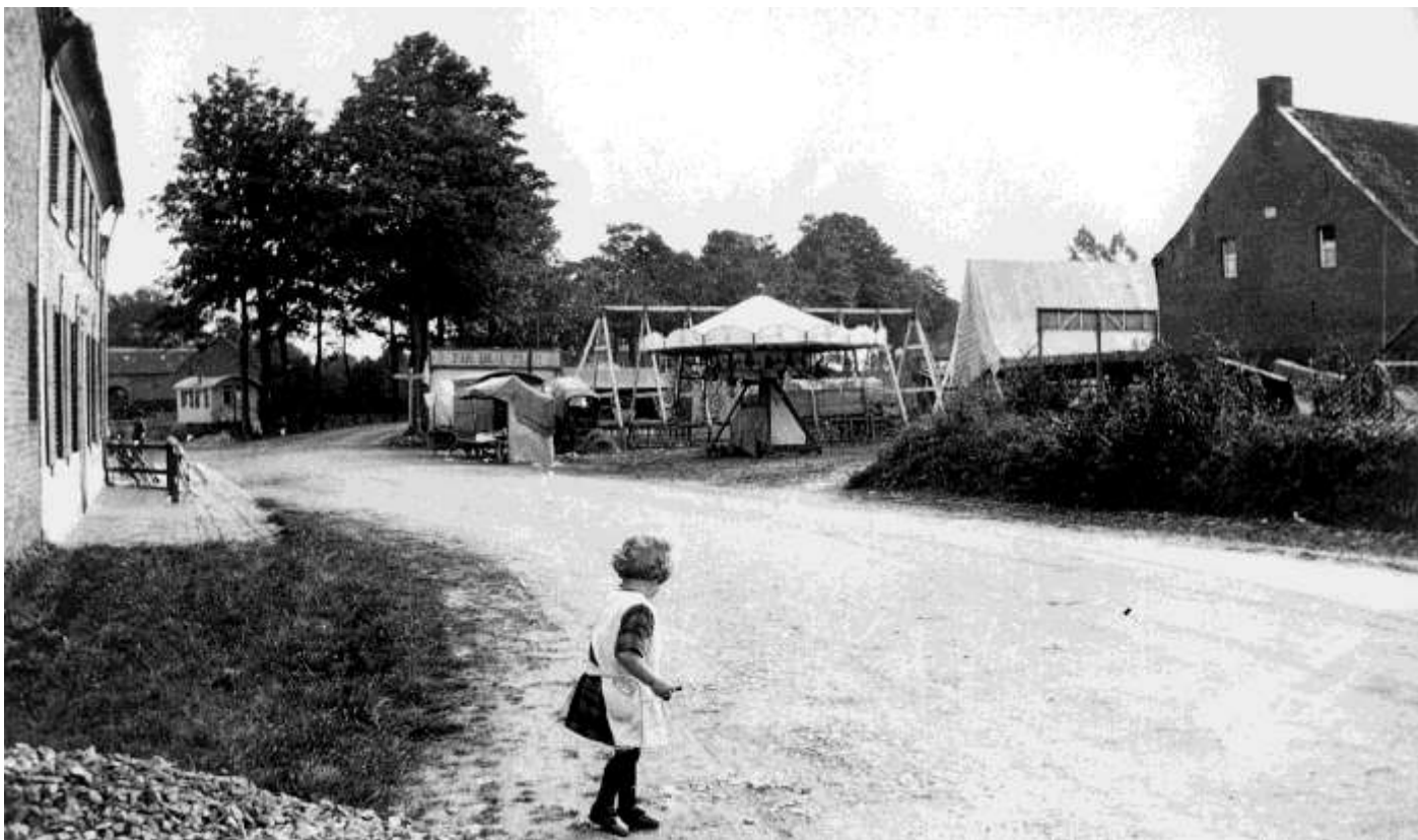
Kermisfoto's uit de jaren '30 uit Gruitrode