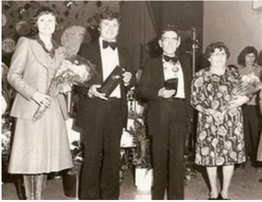
Oprichters van de Broeveskender