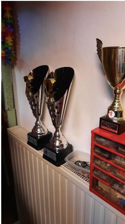
Enkele gewonnen trofeeën