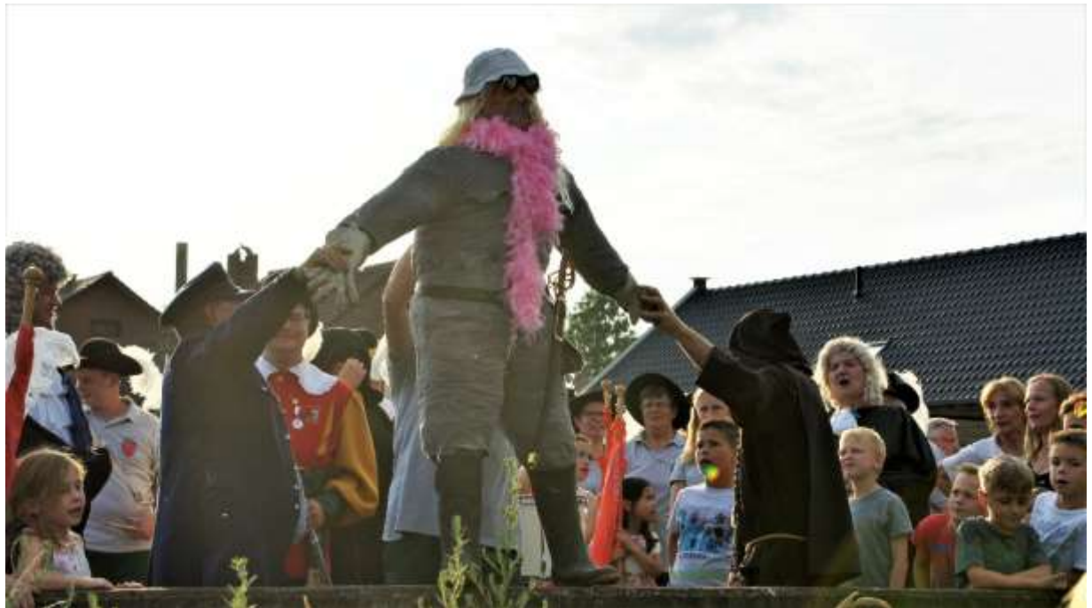
Malbroekverbranding in Molenbeersel