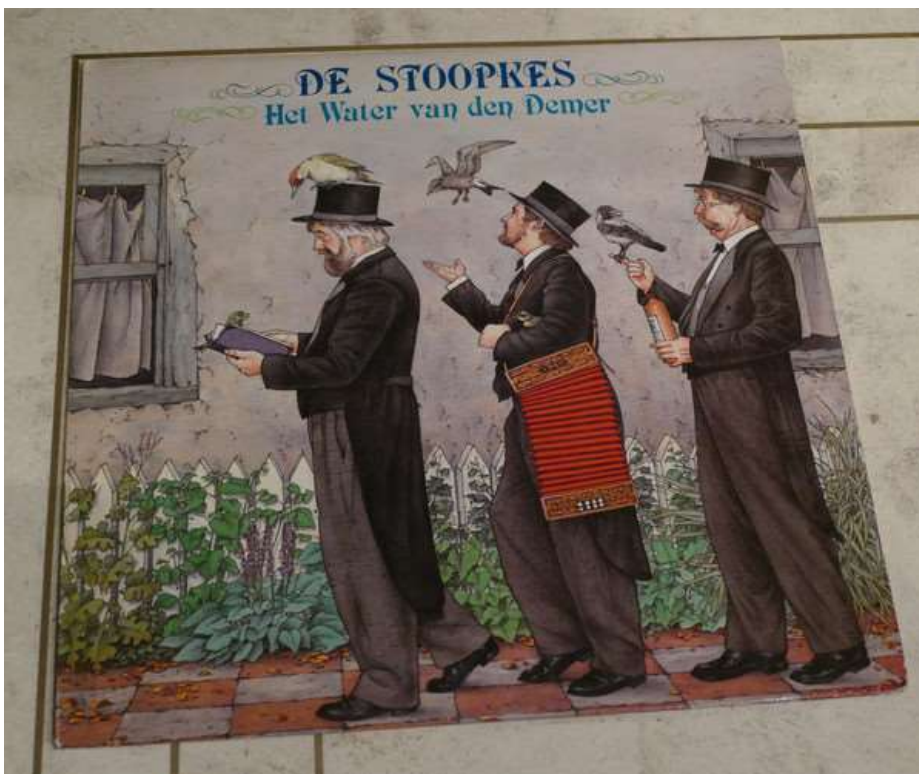
Steeds nieuwe muzikanten maken nieuwe deuntjes met klanken en ritmes uit een ver verleden.