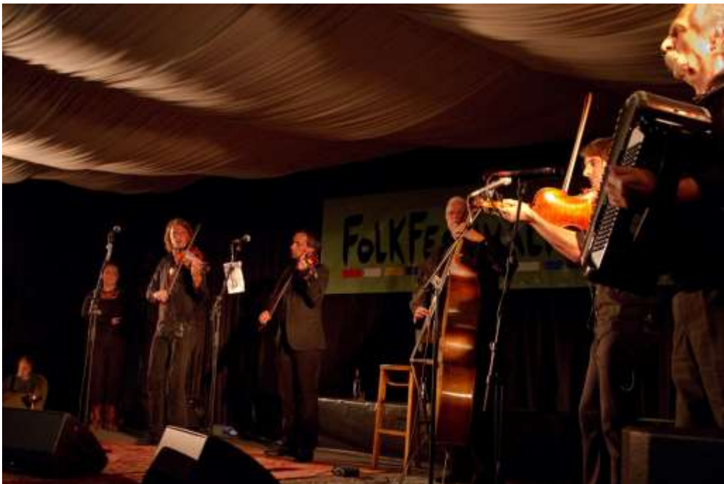
De buitenwereld ziet het niet, maar Limburg telt veel volksmuzikanten, uit binnen- en buitenland. Foto Czarna Gora L. Indestege

Het feit dat er anno 2003 nog steeds met veel liefde traditionele muziek gespeeld wordt, zegt wat, zeker als je weet dat er nauwelijks publieke interesse voor bestaat. Dit toont aan dat er in die volksmuziek een deuntje zit uit de hitparade, dat na een kort succes verdwijnt. Er blijven steeds nieuwe muzikanten komen, die het klankbeeld van muziek met wortels herkennen en hernemen. Een staalkaart van dit soort muzikanten is elk jaar op 30 april in een aantal Hasseltse cafés te bewonderen: Hasselt Goes Folk. Diezelfde avond zijn ook volksmuzikanten te horen op diverse mei-avondvieringen overal in Limburg, onder meer in Genk.