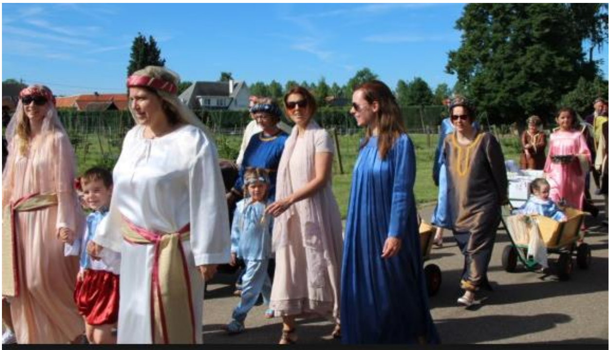
processie 12 juni 2017