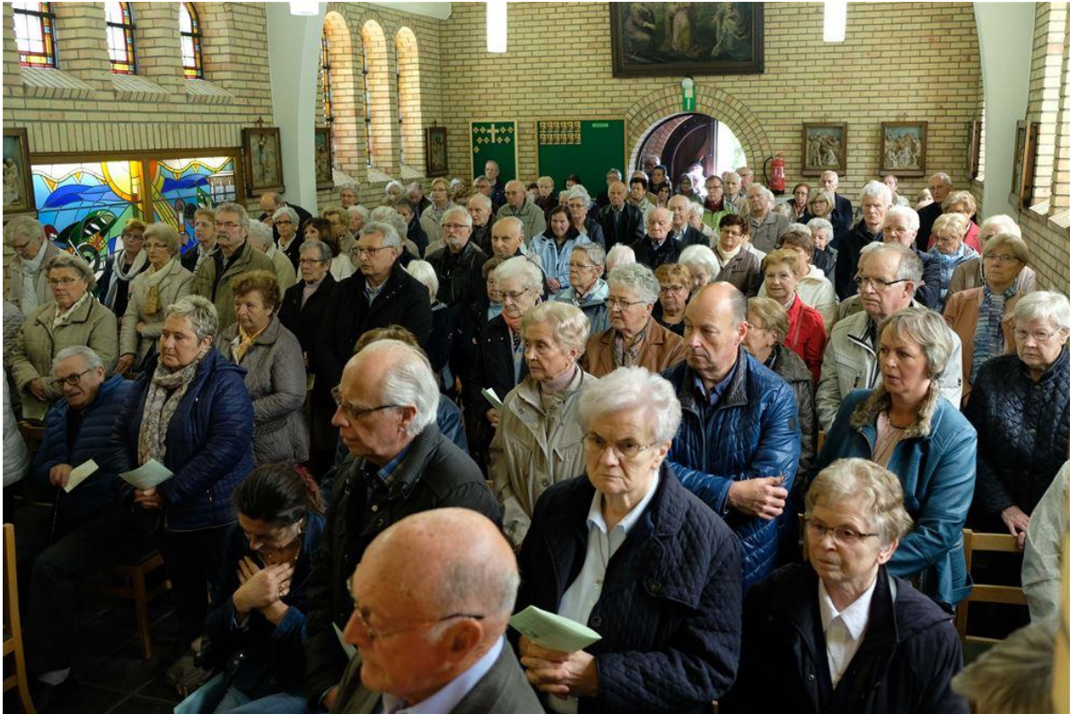
Vertrek van de processie