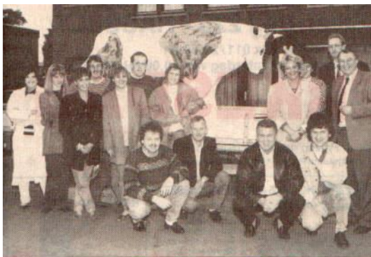
Os van 2 ton voor de deur

De versiering van het huis gebeurt meestal enkele dagen voor de 30 ste verjaardag, in de nachtelijke stilte. Soms wordt de straat tot 100m ver versierd met boompjes vol papieren bloemen. Tevens wordt dan een zelfgemaakte of gehuurde os geplaatst. Sommige ossen zijn van hout, andere betonnen exemplaren wegen tot 2 ton en worden als versperring opgesteld, zodat de gedupeerde 30-jarige wel verplicht is te trakteren om van die hinderlijke os af te geraken. Dergelijke betonnen ossen kunnen onder meer gehurd worden in Meeuwen en Kinrooi, voor 100 tot 200€. Het beschilderen van gevels komt ook voor.