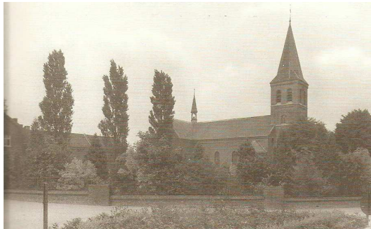
Afbeelding: de Sint-Lambertuskerk van Geistingen

De reden waarom Sint-Lambertus schildhouder in Geistingen is, is de volgende. Neeritter en Ophoven-Geistingen behoorden via Horn tot het graafschap Loon. Een gedeelte van de gemeente behoorde tot 1795 tot het Kathedraalkapittel van Sint-Lambertus te Luik. Vandaar deze keuze.