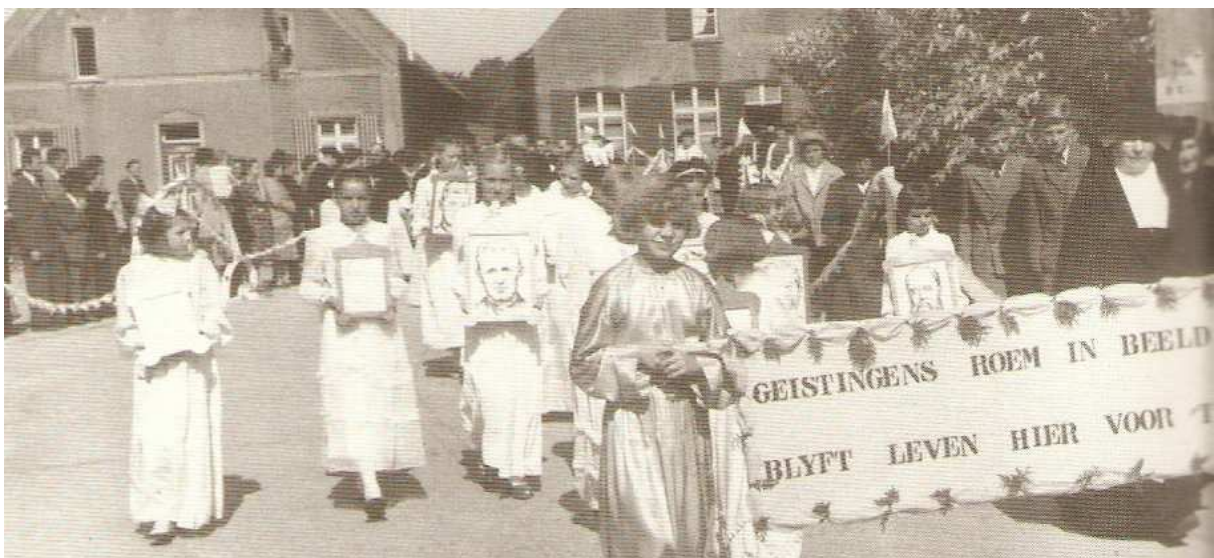
Afbeelding: processie waar de kinderen de potretten dragen van alle Geistinger priesters