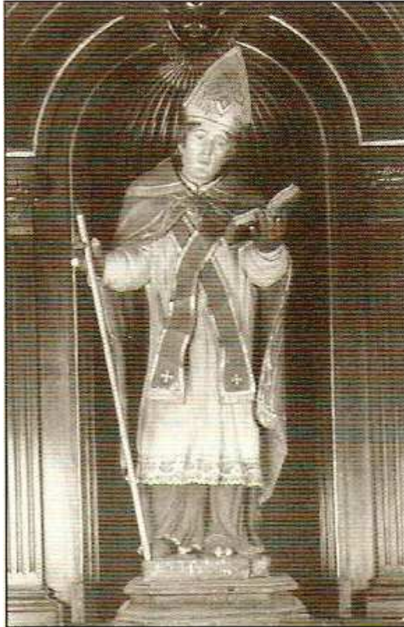
Afbeelding: Lambertus van Maastricht