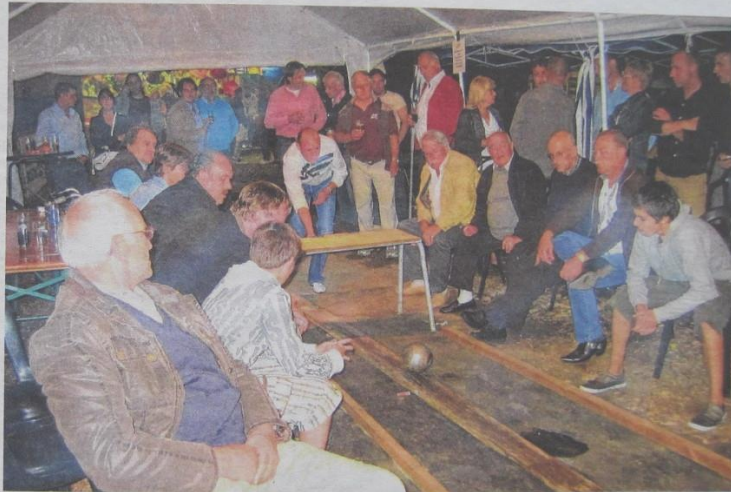
Kermis in Spurk is al sinds 1896 een traditie, die nog altijd veel volk lokt.