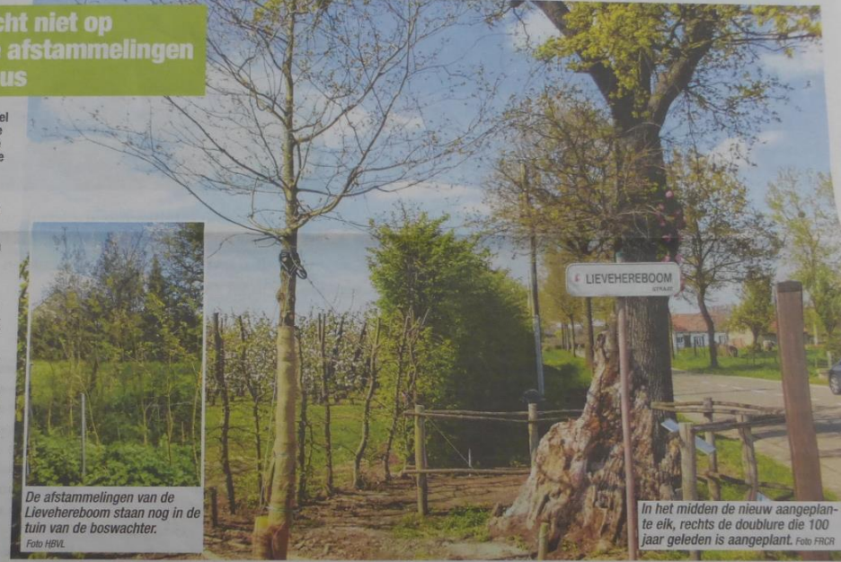
De afstammelingen van de Lievehereboom staan nog in de tuin van de boswachter.