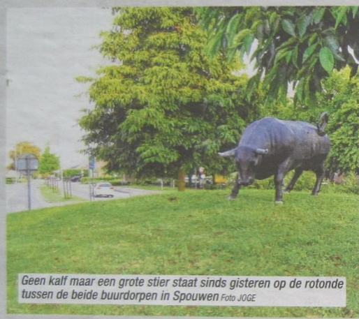
Geen kalf maar een grote stier staat sinds gisteren op de rotonde tussen de beide buurdorpen in Spouwen