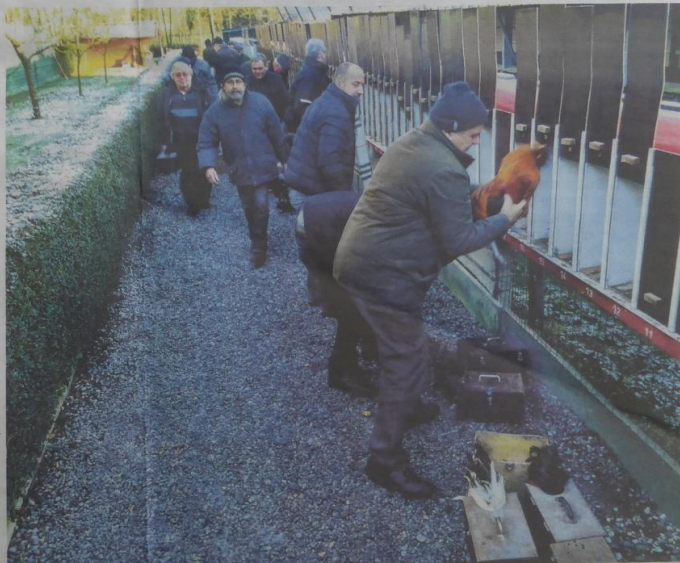
Veel hanenmannen lieten gisteren hun beste zangers thuis.