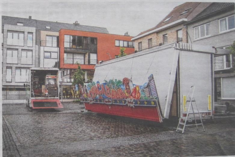
De kermis van juni werd gisteren opgebouwd in het centrum van Diepenbeek.

"Diepenbeek is natuurlijk geen alleenstaand geval", zegt Eugeen Vanlingen. "Meestal zijn het kleinere wijkkermissen die doodbloeden en afgeschapt worden. Maar de gemeentebesturen moeten zich realiseren dat er ook een groep foorreizigers is die net van die kleinere kermissen leven. Bovendien komen er in de komende jaren een 25-tal nieuwe foorkramers bij, jongeren van 16, 17, 18 jaar die in de voetsporen van hun familie treden. Die moeten ook ergens kunnen werken. In mijn familie zijn er gasten die nu al, buiten de winter-