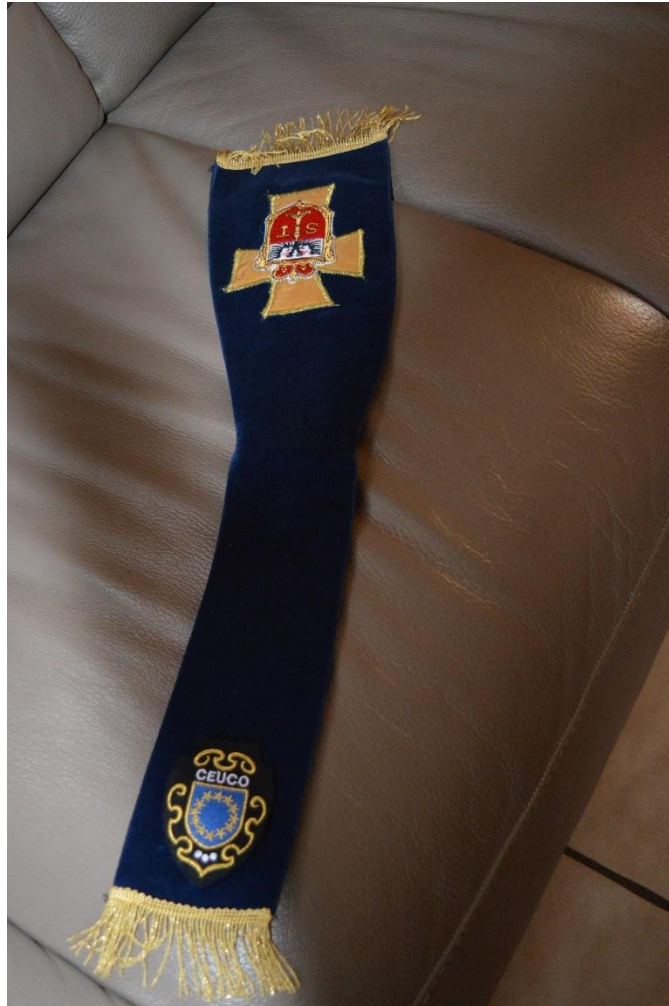
Epitoga van de traditiedrager met het embleem van CEUCO waarvan de Commanderie lid is.