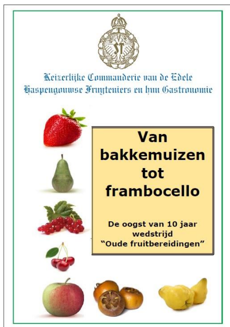
Eén van de publicaties

Daarnaast is de Keizerlijke Commanderie ook de initiatiefnemer om jaarlijks een wedstrijd voor de beste fruitbereiding te organiseren. Je kan meedingen met gebak, gelei, confituur, drankjes, siropen en noem maar op. Een aantal publicaties van de Keizerlijke Commanderie bevatten de neergeschreven recepten van de beste inzendingen.