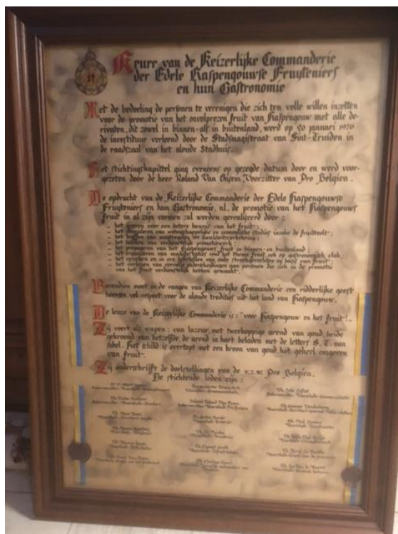
Keure of oorkonde waarbij Pro Belgica vzw de investituur verleent aan de Keizerlijke Commanderie

Hieronder zie je een afbeelding van de officiële keure of oorkonde, waarbij Pro Belgica vzw de investituur verleent aan de Keizerlijke Commanderie. Een document om terecht fier over te zijn!