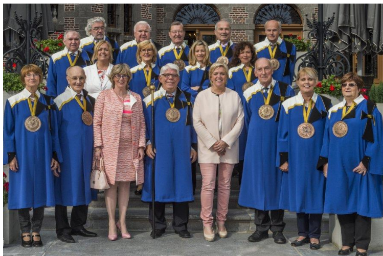
Het praesidium van marschalken in hun nieuwe toga's