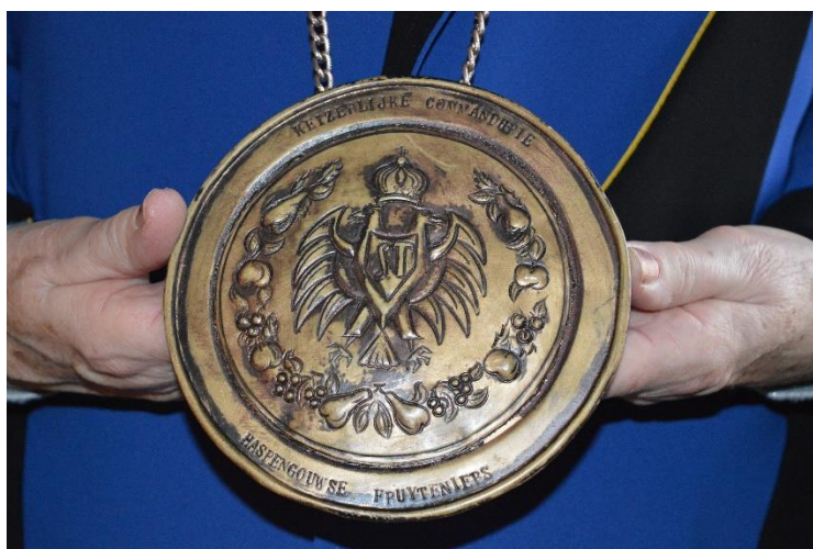
Borstplaat met wapenschild

Over de schouder dragen de leden van het praesidium een ceremonieel lint, de epitoga. Om de hals een borstplaat met daarop eveneens het wapenschild.