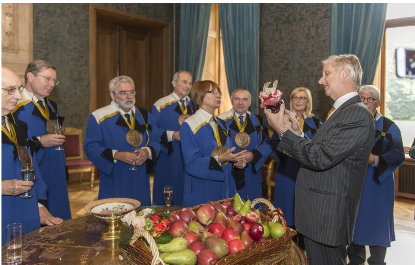
Overhandiging aan de koning van de fruitkorf door een delegatie van de Keizerlijke Commanderie.