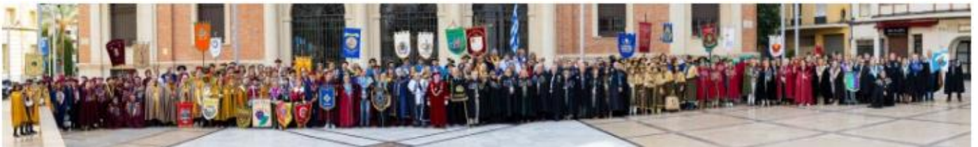
Alle afvaardigingen van de CEUCO leden samen op de foto. Een bont gezelschap!

Internationaal mag de Commanderie er prat op gaan dat zij de tweede Vlaamse broederschap is die lid is van CEUCO (Conseil Européen de Confréries Enogastronomiques). Enogastronomie houdt zich bezig met de kunst van typische gerechten en dranken. Het volgende congres van CEUCO gaat door in de Griekse havenstad Piraeus in november 2024.