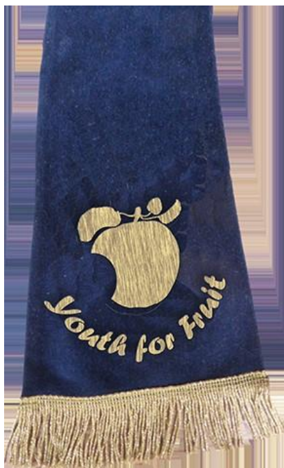
Schouderlint van de Jeugdambassadeur

en de jeugd. Hij of zij wordt gekozen uit de kinderen van Haspengouw en heeft als taak over projecten ter promotie van het fruit bij scholen en jeugdbewegingen, kinderen en jongeren te brainstormen met de leden van de commanderie. Als de school het OK vindt, mag de jeugdambassadeur ook mee naar het Koninklijk Paleis om de fruitmand te overhandigen.